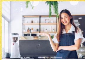
サービス業（外相・宿泊）