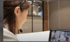
日本語教育のプロによるオンライン指導