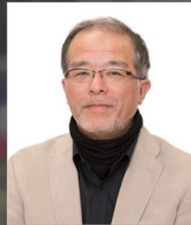
早稲田大学大学院 日本語研究学科 宮崎 里司教授 監修

※ J-HOL (ジェイホル)・・・Japanese Hybrid Online Learningの総称